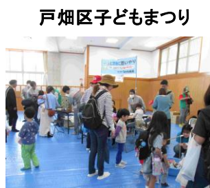
戸畑区子どもまつり