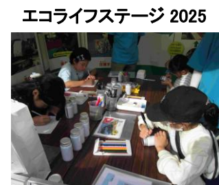
エコライフステージ 2025