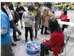
小倉北区子どもまつり